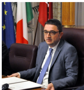
Maurizio Fugatti Presidente Provincia autonoma di Trento

Il Festival della Famiglia di Trento è arrivato alla sua decima edizione. Un traguardo importante che testimonia la centralità che ha la famiglia per la Provincia autonoma di Trento e si collega, anche tramite il Festival, all'obiettivo di tenere viva una riflessione sui temi e le problematiche più attuali.