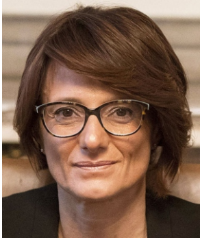
Elena Bonetti Ministra per le pari opportunità e la famiglia

I l Festival della Famiglia di Trento taglia quest'anno il traguardo delle dieci edizioni, confermandosi un appuntamento di valore e di importante confronto sul ruolo della famiglia del nostro Paese.