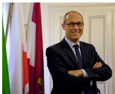
Ugo Rossi Presidente Provincia autonoma di Trento

La finalità di questa sesta edizione del Festival della famiglia è dibattere su un tema fortemente attuale e cioè la necessità di fare rete sul territorio per generare valore, sviluppo, innovazione. In una parola: crescita sociale ed economica . Le policy pubbliche non possono più indirizzare i loro piani utilizzando un unico paradigma, la mera gestione economica di bilancio, bensì adottare una visione più globale che includa anche i nodi delle reti di sistema generatrici di benessere sociale. Questo passaggio potrebbe innestare un mutamento qualitativo culturale, che apporterebbe nuova linfa alle reti istituzionali, economiche e personali che vivono, abitano e sviluppano il nostro territorio provinciale e la sua identità.