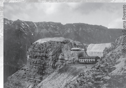
Museo Storico, Guerra Rovereto

Le regioni CLLD hanno definito d'intesa con l'Euregio Tirolo-Alto Adige-Trentino le proprie strategie transfrontaliere, per la cui attuazione si avvarranno del sostegno della segreteria generale dell'Euregio. Alla luce del fatto che Euregio e Interreg perseguono lo stesso obiettivo generale, che è quello di rafforzare la cooperazione transfrontaliera – anche se l'Euregio opera a livello regionale e i consigli Interreg a livello locale – una più strutturata cooperazione tra le diverse realtà contribuisce in modo decisivo a livello politico e amministrativo a far sì che i consigli Interreg possano attuare con successo le proprie strategie concretizzando così, a livello locale, l'integrazione tra i territori all'interno dell'Euregio.