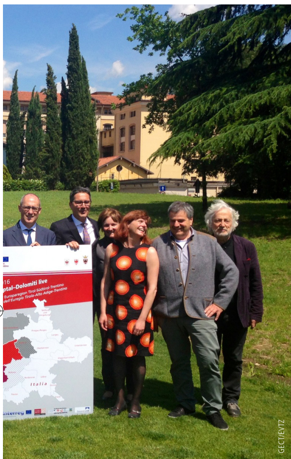
I presidenti del Tirolo, Alto Adige e Trentino con i rappresentanti dei cd "Interreg-Räte" (Consigli Interreg) che hanno sede nel territorio dell'Euregio ("Terra Raetica" nella Val Venosta e il Tirolo Oberland, insieme con la Bassa Engiadina svizzera; "Wipptal" nella due parti sud -Alto Adige- e nord -Tirolo-; "Dolomiti live" con la Val Pusteria e il distretto di Lienz -Tirolo orientale-, insieme con il GAL Alto Bellunese). (Assemblea del GECT - 25 maggio 2016, Rovereto)

Che cosa accomuna la "Ciclabile dell'amicizia" da Monaco a Venezia attraverso il Brennero e il progetto dal titolo "Donne che decidono"? In entrambi i casi si tratta di iniziative finanziate dal Fondo europeo per lo sviluppo regionale FESR, volte a rafforzare i rapporti transfrontalieri e ad assicurare una ricaduta concreta delle attività di cooperazione a vantaggio della popolazione locale.