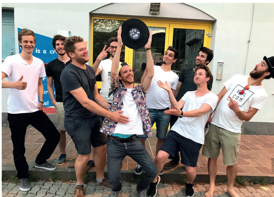
La band tirolese Jimmy & the Goofballs Band Jimmy & the Goofballs aus Tirol

über Pop, Acid Jazz und Electro vertraten, wussten sie das Publikum durch ihre gemeinsame Leidenschaft in den Bann zu ziehen. Die drei Gewinnerbands erhielten Gutscheine für ihre weitere musikalische Ausbildung und freuen sich nun auf neue Konzerttermine im Rahmen des Musikexports von UploadSounds, der die Bands auf Tour durch die Europaregion schickt.