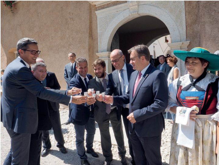
Alcune immagini della seduta del GECT a Sanzeno Einige Eindrücke der EVTZ-Vorstandssitzung in Sanzeno