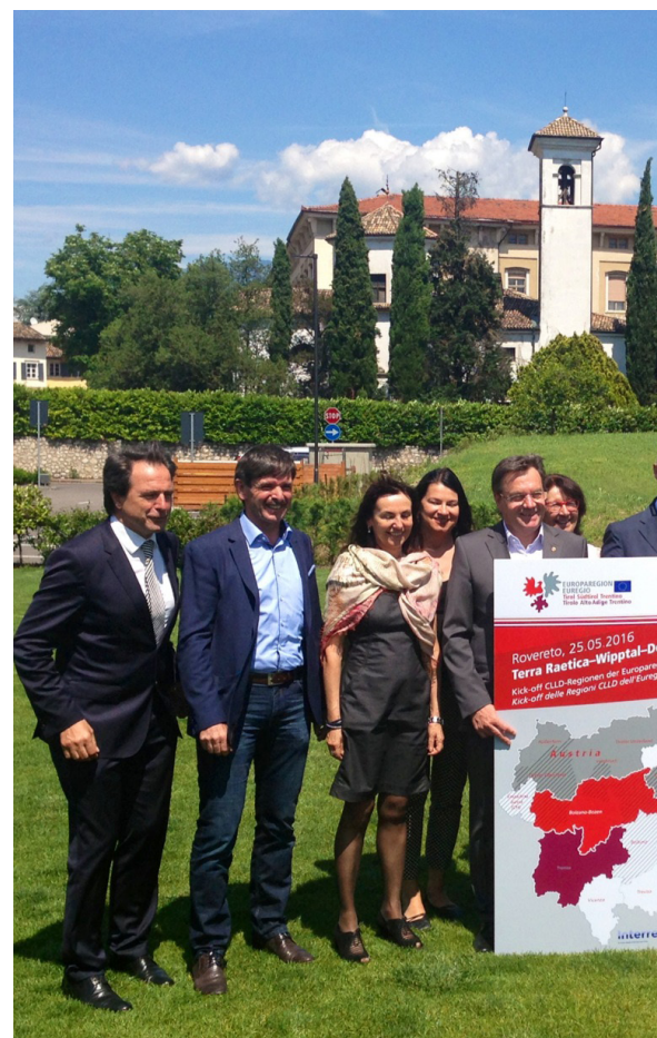
Bei der EVTZ-Vorstandssitzung in Rovereto am 26. Mai 2016: Die Landeshauptleute von Tirol, Südtirol und Trentino mit VertreterInnen der Interreg-Räte, die ihren Sitz in der Euregio haben. („Terra Raetica“ im Vinschgau und Tiroler Oberland sowie Engadin; „Wipptal“ in Nord- und Südtirol, „Dolomiti live“ mit Pustertal, Osttirol und Belluno)

Mit diesen Mitteln fördert das Programm italienisch-österreichische Kooperationsprojekte in den Bereichen Forschung und Innovation, Natur und Kultur, Ausbau institutioneller Kompetenz und Regionalentwicklung auf lokaler Ebene.