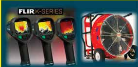
ATTREZZATURE DA INTERVENTO E DPI