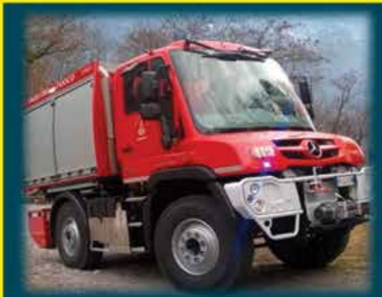
VEICOLI ANTINCENDIO E DI SOCCORSO