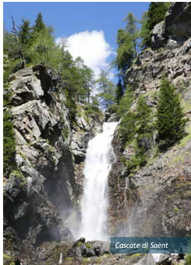
Cascate di Saènt