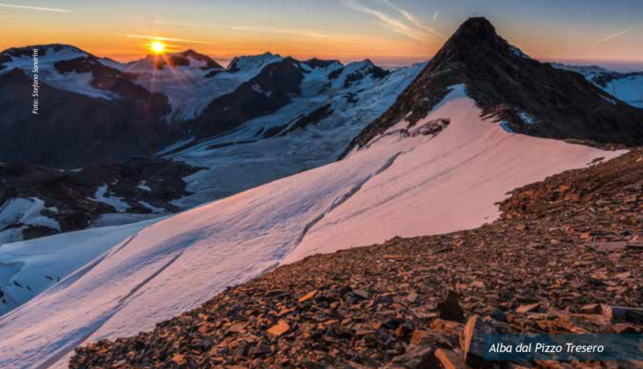
Alba dal Pizzo Tresero