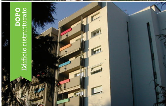
DOPO Edificio ristrutturato