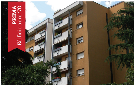
PRIMA Edificio anni '70